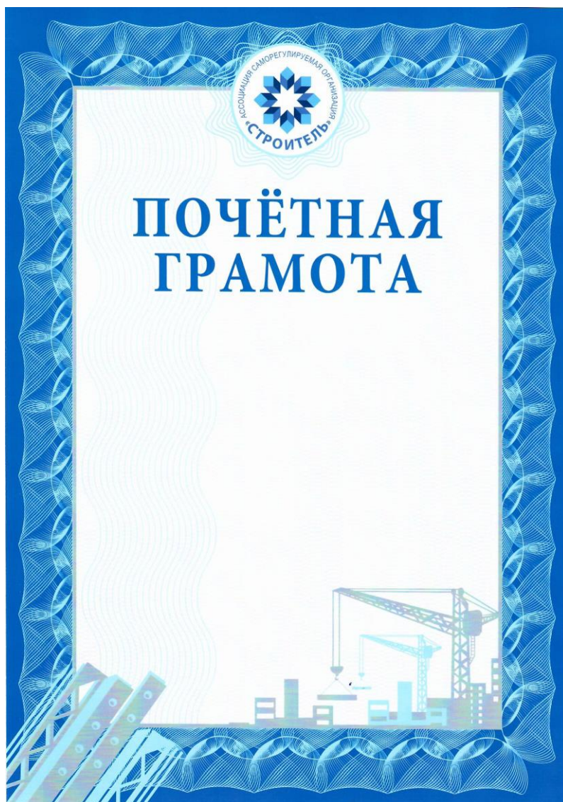
Рисунок бланка Почётной грамоты Ассоциации саморегулируемой организации «Строитель»